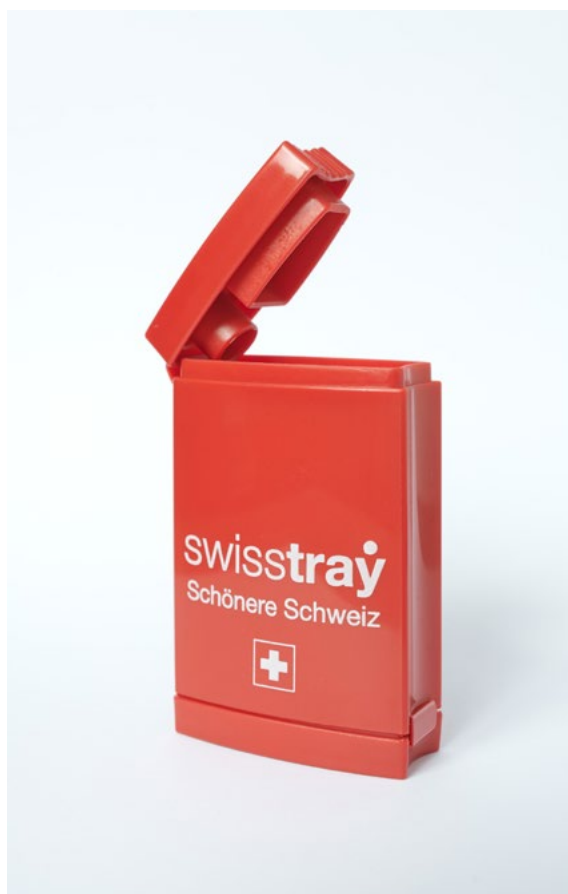
swisstray - le cendrier de poche le plus pratique sur le marché

L'entreprise vise à éliminer les déchets de cigarettes dans le respect de l'environnement, grâce à take tray, un produit innovant. Cette solution efficace est destinée aux fumeuses et fumeurs ainsi qu'aux villes, communes, entreprises et autres organisations confrontées au problème. Avec le cendrier de poche « swisstray », les cendres et mégots ne finissent plus dans la nature, ce qui diminue les coûts de nettoyage pour les collectivités.