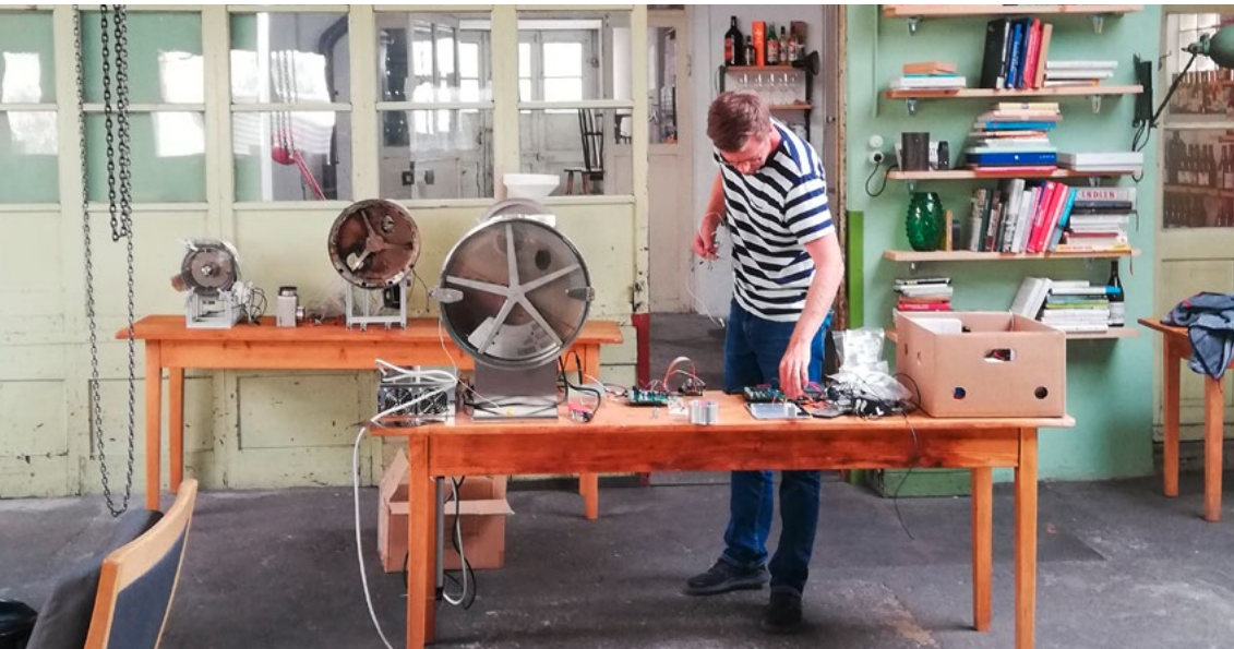
Fabrication des prototypes

La jeune entreprise mikafi modélise l'infrastructure, le réseau et l'expertise des brûleries de café établies, pour en faire une prestation numérique destinée à la gastronomie. mikafi découple ces sociétés de la chaîne de création de valeur afin de démocratiser et décentraliser le processus de torréfaction. L'objectif est de vendre un café durable, frais et personnalisé à un coût bien plus avantageux.